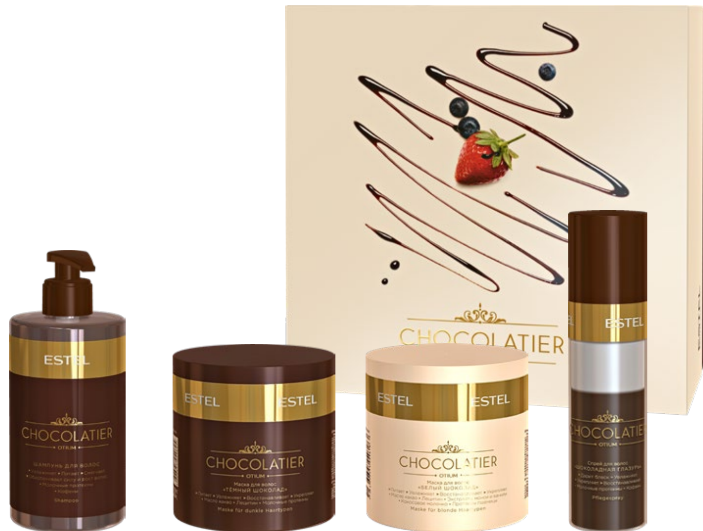
ШАМПУНЬ ДЛЯ ВОЛОС «ТЁМНЫЙ ШОКОЛАД» ESTEL CHOCOLATIER