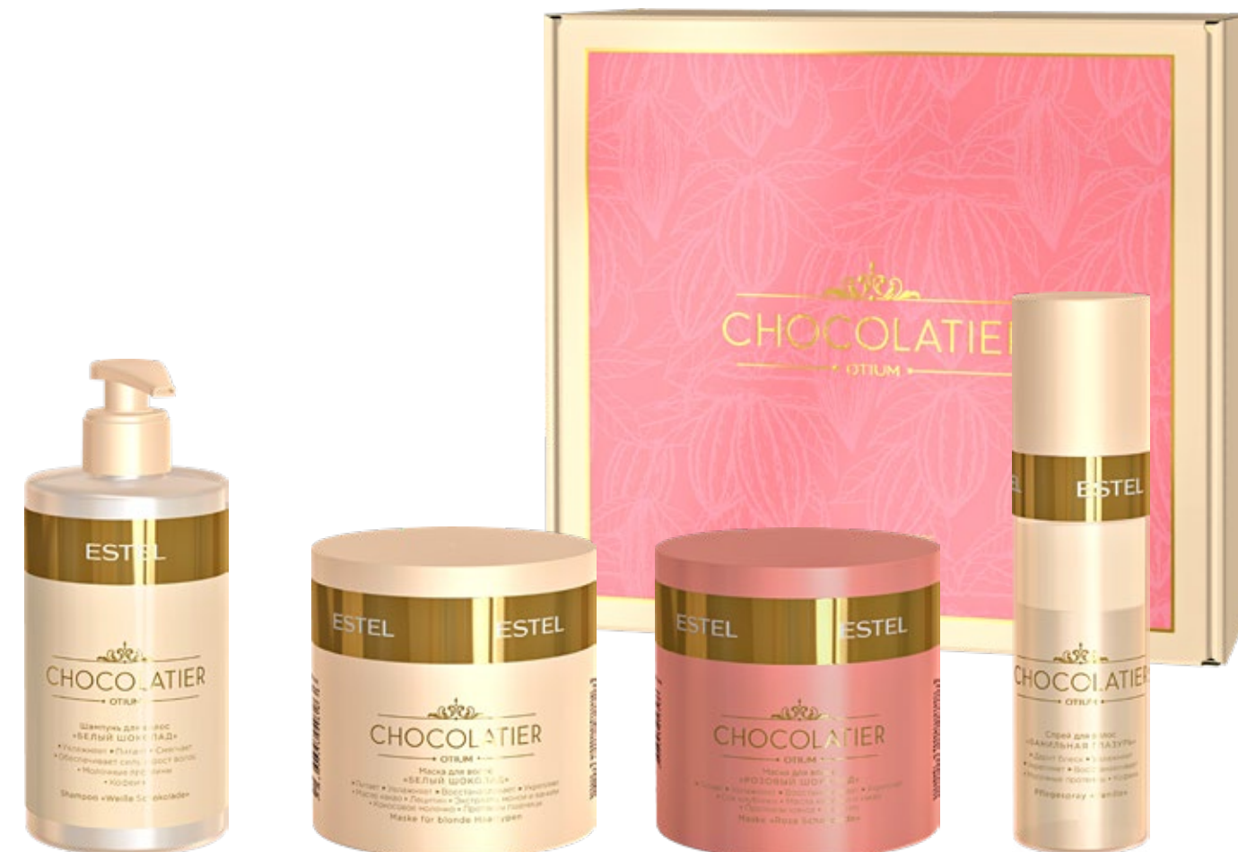
ШАМПУНЬ ДЛЯ ВОЛОС «БЕЛЫЙ ШОКОЛАД» ESTEL CHOCOLATIER