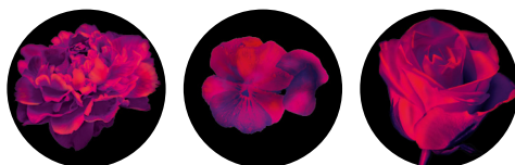
Пион Фиалка Роза

ШАМПУНЬ ДЛЯ ВОЛОС С ЦЕННЫМИ ЭКСТРАКТАМИ ESTEL ЦВЕТОЧНЫЙ ЭКСТАЗ