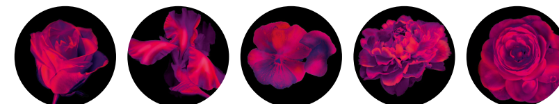
Роза Ирис Фиалка Пион Магнолия