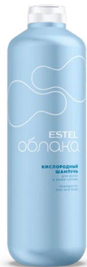
Кислородный шампунь ESTEL ОБЛАКА