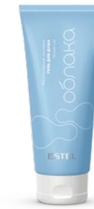
Гель для душа «Кислородный коктейль» ESTEL ОБЛАКА