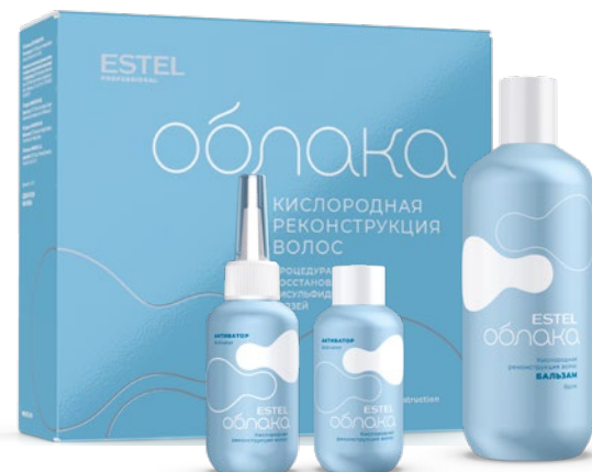
Набор для процедуры «Кислородная реконструкция волос» ESTEL ОБЛАКА • Активатор для процедуры, 100 мл * 2 шт • Бальзам для процедуры, 400 мл

Рекомендуем: используйте несмываемый уход — кислородную пенку для волос ESTEL ОБЛАКА