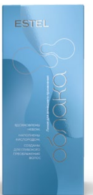
Набор «Кислородный коктейль» ESTEL ОБЛАКА

Арт. CD/N4 Шампунь, бальзам, пенка, гель