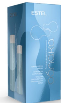
Набор «Кислородное насыщение» ESTEL ОБЛАКА

Арт. CD/N4 Шампунь, бальзам, пенка, гель